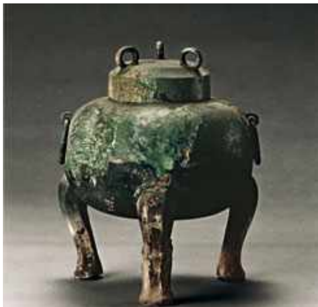
«Дин». Китай. 1320 г. до н.э.

«Дин» изначально — это огромный горшок с тремя ножками, который использовали в ритуалах или как символ власти. Изначально на треножниках гравировали лишь имя владельца. Но со временем на бронзе стали оставлять и более длинные надписи о том, для чего и когда был отлит треножник.